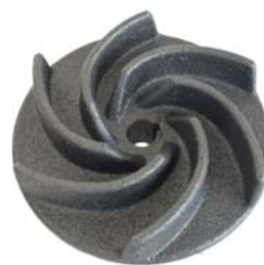
Vortex NC / ND

Sur demande les tensions et les fréquences peuvent être différentes.